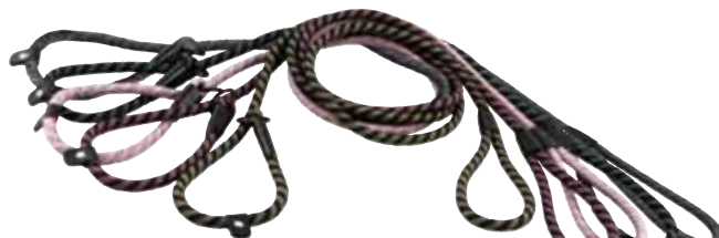
Retriever Rope Leash