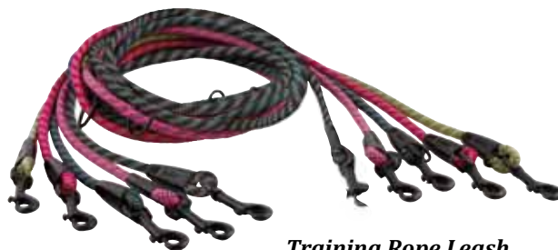
Training Rope Leash