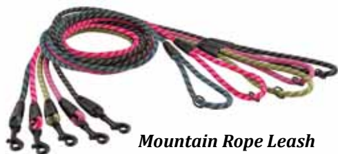
Mountain Rope Leash